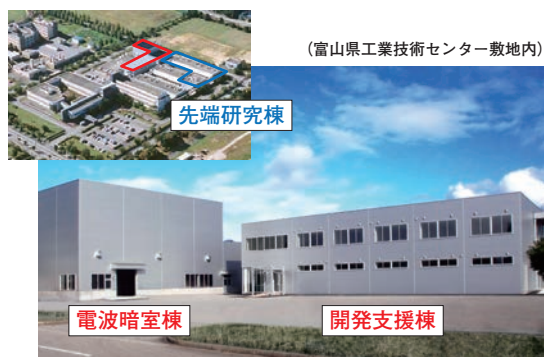
写真1 富山県ものづくり研究開発センター

2012年11月より、IICは富山県ものづくり研究開発センター（富山県高岡市：写真1参照）内の開発支援棟に入居し、サテライトオフィスとして活動を開始した。