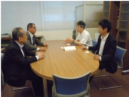
写真2 サテライトオフィス内風景

しており、ファイバーレーザーを使った加工技術の開発に向け月1回のペースで研究会を開催している。