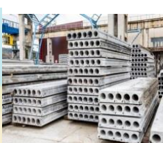
コンクリート工場