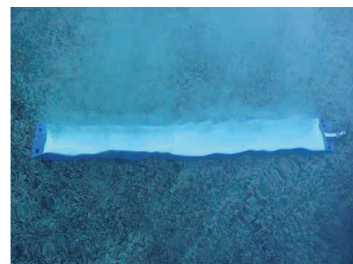
散気板からの微細気泡